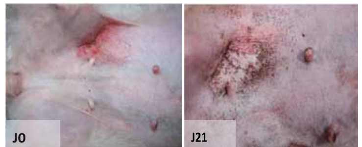
Cas d'hypercorticisme iatrogène